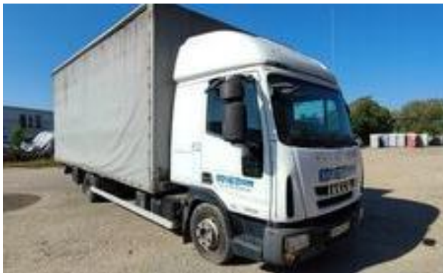
IVECO EuroCargo 75E16,, kamion s ceradom,2008g.,5.200 €, 130 kW, SC LAKIHEGY SRL

Za pribavljanje točnih informacija o stanju tržišta koristili smo kataloge i tehničke specifikacije i informacije pribavljene preko javno provjerljivih poslovnih stranica proizvođača Iveco FIAT, kao i trgovaca vozilima te privatnim prodavateljima vozila i internet ponude. U nastavku donosimo specifikacije i izvode iz ponuda. Međutim, javno oglašene cijene za sve vrste vozila, naprimjer u oglasima ili često putem Internet oglasa se moraju korigirati za odgovarajući postotak na niže, u odnosu na oglašenu ponudu.