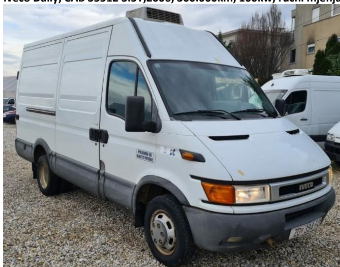
IVECO DAILY 35c13v ,2004, 4.450 €, 375.000 km, Diesel, 92 kW, autosalon Samobor,

Vrlo lako smo pronašli tri istaknute ponude. Procjenjivani kombi je u nešto lošijem stanju ( ocjena stanja po tablici je za 1) i zbog toga se procjenjuje da se svota ove procjene dodatno umanjuje za 50% na temelju strojarske procjene upotrebljivosti i mogućih popravaka. Prosječna cijena tri vrlo slična kombija je 4.366,66 €, a nakon umanjenja zbog bitne razlike u kakvoći od 50% ,konačna procjena je =2.183,33 € .