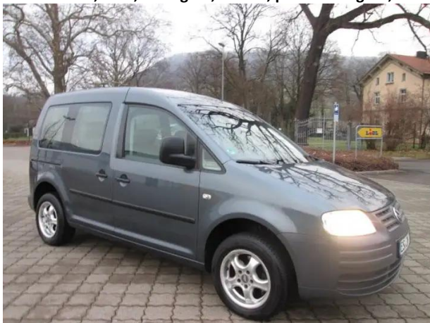
VolkswagenCaddy,1.4, 2.450€, 189.000 km, Ručni mjenjač,04/2004,55 kW, auto.scout24