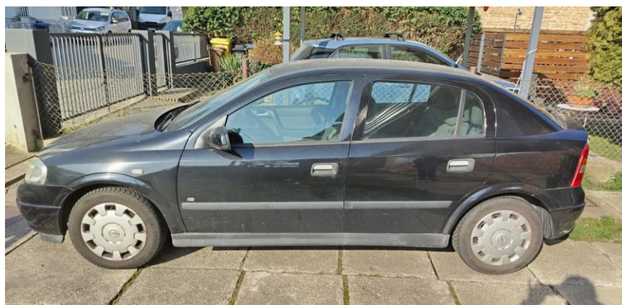
Opel Astra 1.7. CDTi , 2008 g., 170.000 km, 2.000€, 76 kw, Indeks .hr

Ovih modela Opel Astra 1.7 , diesel, na tržištima polovnih automobila, ima uistinu veliki broj a odabrani po specifikacijama i održavanju najviše odgovaraju procjenjivanom vozilu. Sva prezentirana vozila imaju knjižicu servisa i tehnički su održavana , nisu oštećene i slične su kilometraže, sva su u voznom stanju i tehnički ispravna .Analizom svih cijena, uvažavajući tehničke podatke izponude zaključujemo da je prosječna ponudbena cijena vozila Opel Astra 1,7 CDTi, 2008 g, je =2.333,33 €, a prema ocjeni stanja za 1 loše do neupotrebljivo , dakle sa umanjnjem za 60% , cijena našeg vozila Opel Astra 1.7 CDTi, 2008 , 400.000 km je = 933,33 € .