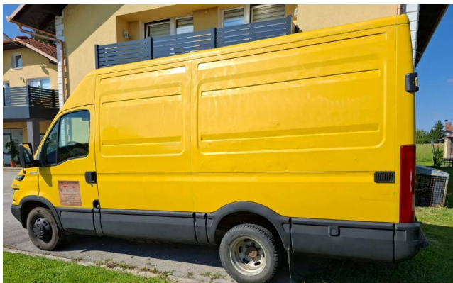
IVECO DAILY 35 C 12, 2006 g., 85 kW, 326.000 km, 5.750€, Zgb, Njuškalo.hr

Za pribavljanje točnih informacija o stanju tržišta koristili smo kataloge i tehničke specifikacije i informacije pribavljene preko javno provjerljivih poslovnih stranica proizvođača Iveco FIAT, kao i trgovaca vozilima te privatnim prodavateljima vozila i internet ponude. U nastavku donosimo specifikacije i izvode iz ponuda. Međutim, javno oglašene cijene za sve vrste vozila, naprimjer u oglasima ili često putem Internet oglasa se moraju korigirati za odgovarajući postotak na niže, u odnosu na oglašenu ponudu.