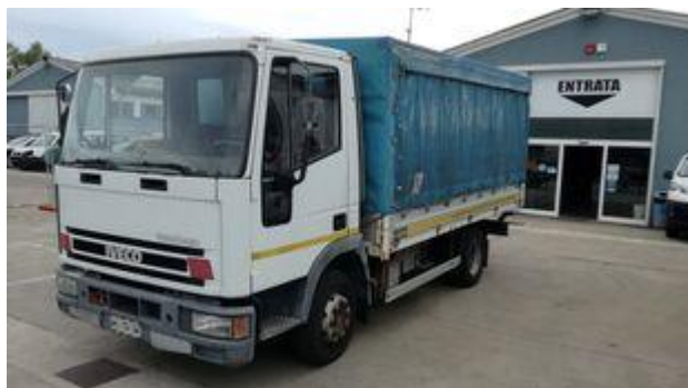
IVECO EUROCARGO 80E15 kamion s ceradom, 3.800 €, 68.103 km, 1995, 105 kW, Italija Vicenza, autoline.de

IVECO Eurocargo 100E17 kamion sa kliznom ceradom, 2005, 6.850 €, 443.021 km, Lokacija: Belgija, Wingene, zadnja hidraulična rampa, www.autoline