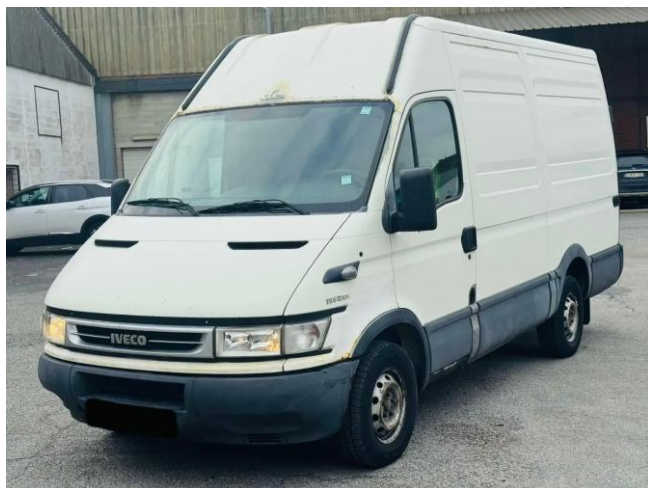
Iveco Daily, CAB 35512 3.5T, 2006, 300.000km, 100kw, ručni mjenjač, Charleroi, BE, 2.900 €, Auto scout 24,