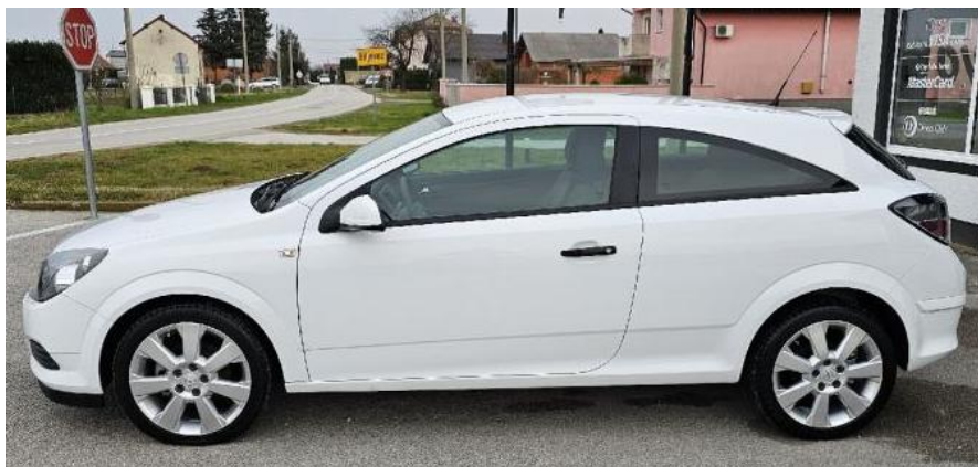
Opel Astra 1.7 CDTi GTC, 110 ks, 3.500€, 2009, 214.000km, 81kW, www.korpar , Zgb