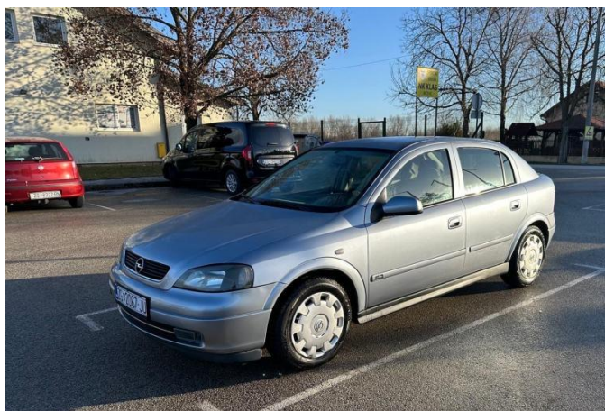
Opel Astra 1.7 CDTi, 2004, 290.000km, 1.500€, Njuškalo.hr