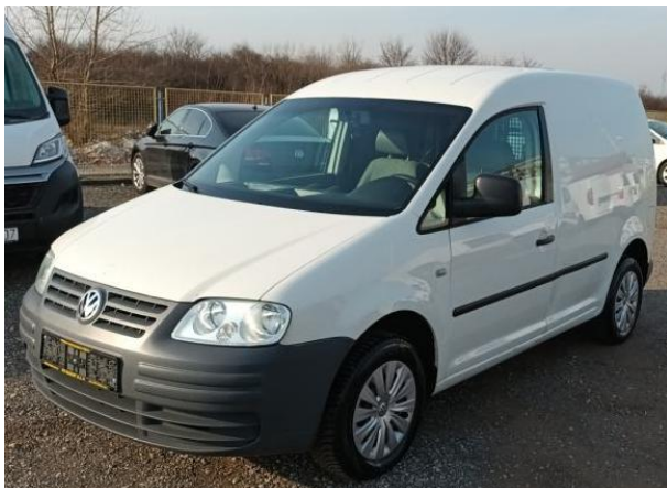
VW CADDY 2,0 SDI, 2004 god.,3.500 €, privatno-Zagreb,51 kW, 292.000 km, mjenjač ručni

Za pribavljanje točnih informacija o stanju tržišta koristili smo kataloge i tehničke specifikacije i informacije pribavljene preko javno provjerljivih poslovnih stranica proizvođača Volkswagen DE, kao i trgovaca vozilima te privatnim prodavateljima vozila i internet ponude .U nastavku donosimo specifikacije i izvode iz ponuda: