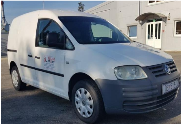
Volkswagen Caddy 2.0 SDI FURGON, 2004 g., 3.500 €, 51 kw, 327.000 km, www/kulijatrans

Ovih modela vozila Volkswagen CADDY 2.0 SDI, diesel, na tržištima polovnih automobila, ima uistinu veliki broj a odabrani po godištu, specifikacijama i održavanju najviše odgovaraju procjenjivanom vozilu. Sva prezentirana vozila imaju knjižicu servisa i tehnički su održavana, nisu oštećene i slične su kilometraže, sva su u voznom stanju i tehnički ispravna. Analizom svih cijena, uvažavajući tehničke podatke iz ponude zaključujemo da je prosječna ponudbena cijena vozila Volkswagen CADDY 2.0 SDI, 2004 g., je =3.150, €, a prema ocjeni stanja za 1 loše do neupotrebljivo, dakle sa umanjnjem za 50%, cijena našeg vozila Vw Cady, 2004, prešao 750.000 km je =1.575,00 €.